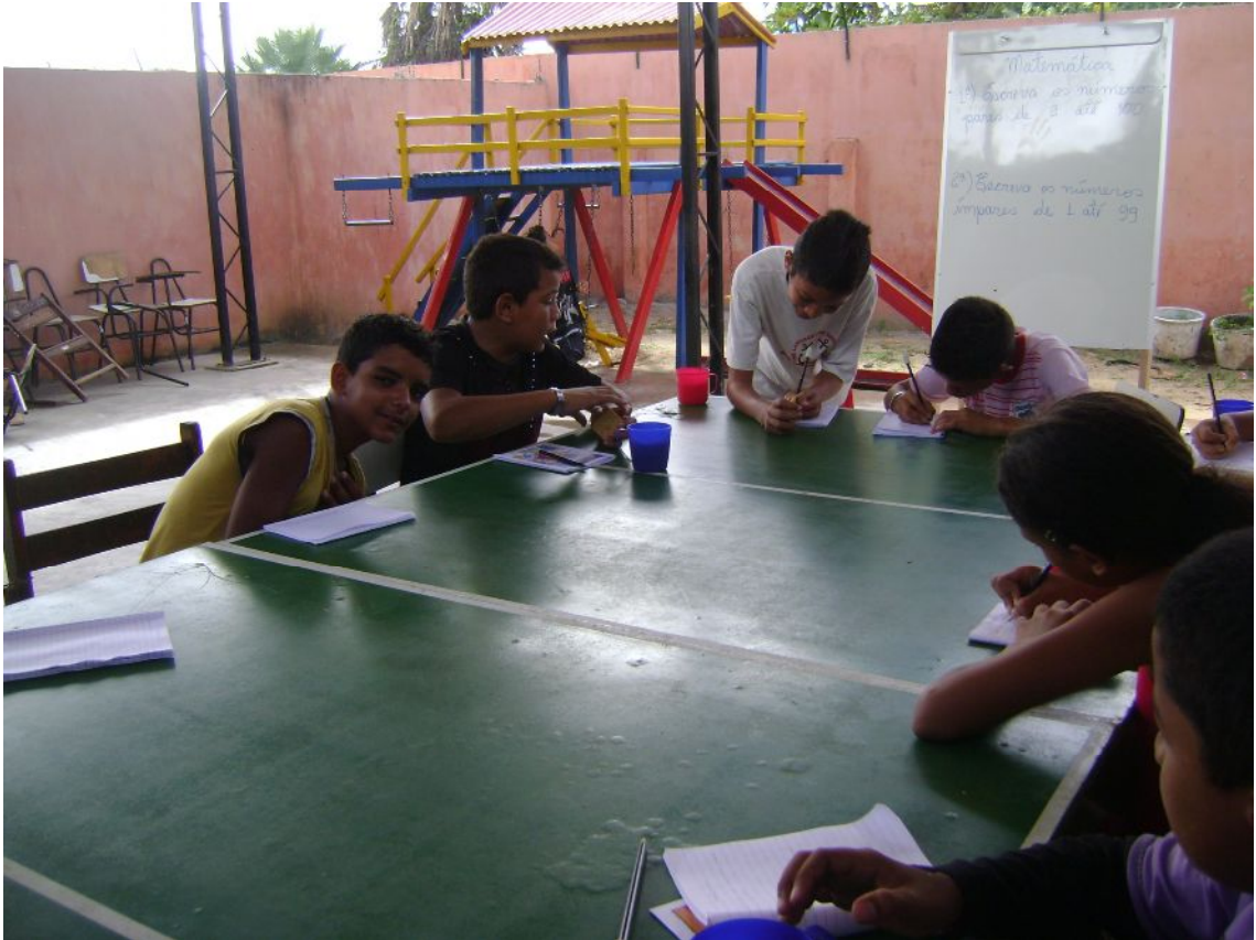
Oficina de Matemática – Programa Mais Educação – Escola Maria de Lourdes Silva

d) Rádio escolar: geralmente ocorre na biblioteca da escola ou no pátio reservado ao Mais Educação. Envolve um pequeno grupo de crianças na montagem dos equipamentos (notebook, caixa de som, microfone, data show) para durante o recreio selecionarem músicas e divulgarem recadinhos que os demais enviam.