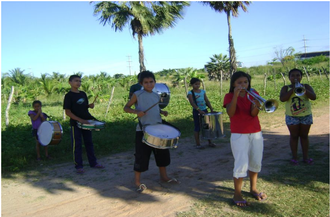
Oficina de fanfarra – Aula prática em frente à Escola Maria de Lourdes Silva

Como alternativa, às vezes, reúne as crianças fora da escola para realizar aulas práticas, contudo não deixa de ser uma opção arriscada, já que todos ficam expostos à violência do local, numa rua de acesso, sem pavimentação e completamente isolada.