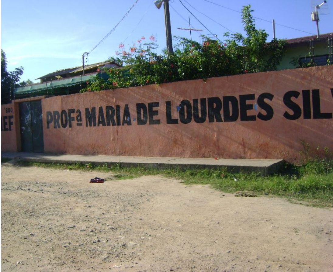
Fachada da Escola Maria de Lourdes Silva – Alto Alegre II/ Maracanaú-CE

vulnerável à violência. As vias de acesso à escola não são pavimentadas e causam muitos transtornos aos transeuntes.