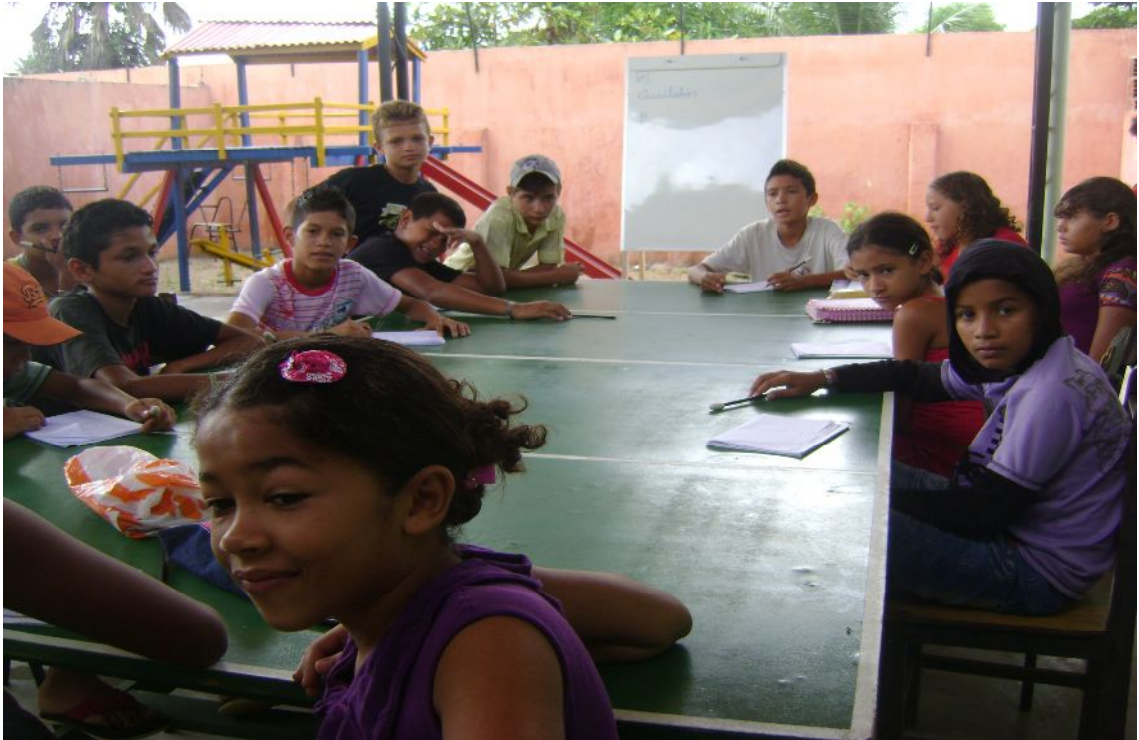
Oficina de Letramento – Programa Mais Educação – Escola Maria de Lourdes Silva

c) Matemática: para esta atividade, a escola dispõe, além do pequeno pátio coberto, de uma sala de aula comum, onde as crianças permanecem por quase duas horas, duas vezes por semana, com uma monitora. A escola divide a turma para duas monitoras, que são irmãs, e elas são responsáveis pelas oficinas de Letramento e Matemática. Trata-se de um momento pouco atrativo, onde as crianças demonstram certa resistência em participar.