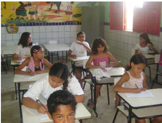
Sala de aula

Possui todos os espaços administrativos, como sala dos professores, secretaria e sala da gestão. Quanto aos espaços pedagógicos, a escola dispõe de 12 salas de aula, biblioteca e laboratório de informática. Ainda podemos citar os ambientes de serviços e as áreas comuns, como cozinha, depósito de merenda, almoxarifado, banheiros e pátio coberto. Todos em bom estado de conservação. Vale ressaltar que a escola possui um espaço reservado para a construção de quadra esportiva coberta, que, atualmente é utilizado como espaço de lazer para as crianças na hora do recreio e para a prática de atividades esportivas.