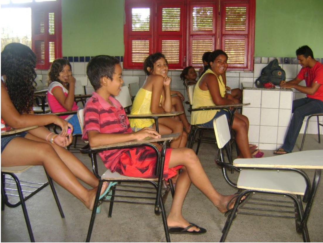
Oficina de Fanfarra – Programa Mais Educação – Escola Maria de Lourdes Silva

f) Programa Segundo Tempo: não se trata de mais uma oficina do Mais Educação e sim de um outro programa que é desenvolvido paralelamente na Escola Maria de Lourdes Silva. Em resumo, pois o mesmo não se constitui em nosso objeto, é uma ação do Ministério do Esporte e, segundo seus próprios termos, tem por objetivo democratizar o acesso à prática do esporte, de forma a promover o desenvolvimento integral de crianças, adolescentes e jovens, como fator de formação da cidadania e melhoria da qualidade de vida, prioritariamente em áreas de vulnerabilidade social. Acontece duas vezes por semana, sob a coordenação de um educador físico, que envolve as crianças na prática esportiva.