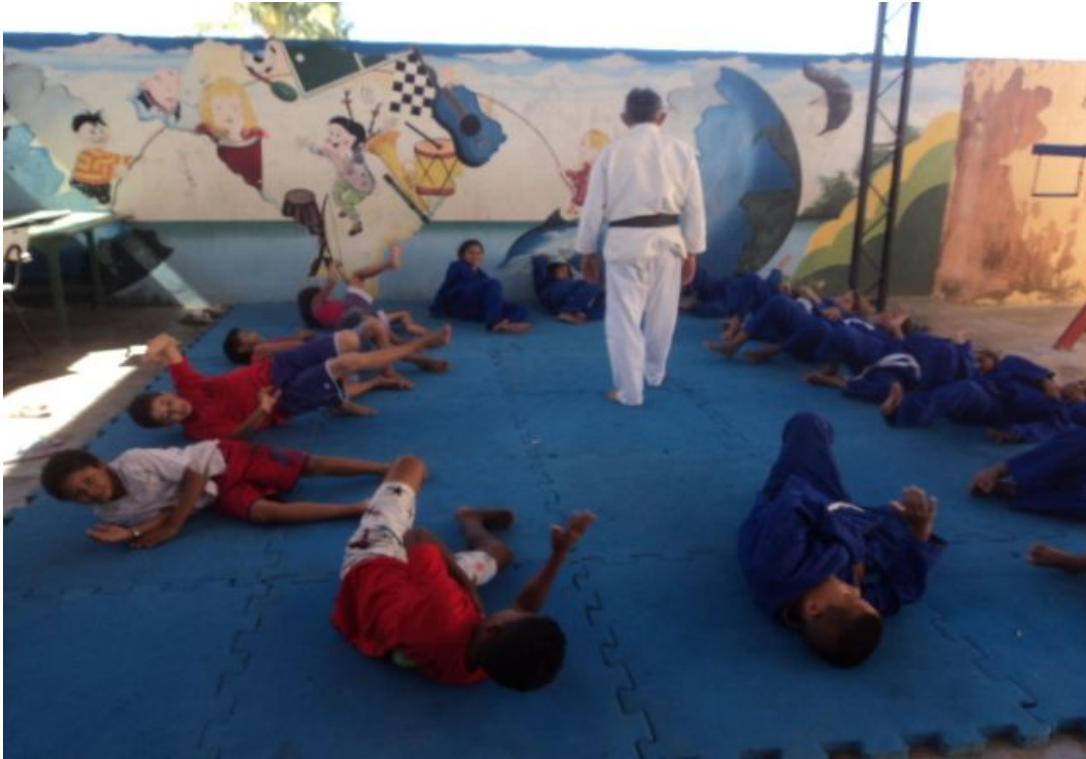
Oficina de judô – Programa Mais Educação – Escola Maria de Lourdes Silva/2012

b) Letramento: Acontece, frequentemente, em um pequeno pátio coberto, com mesas e cadeiras, lousa móvel e um playground que dispersa as crianças. É um ambiente muito tumultuado. Em média, essa atividade conta com a presença de 26 crianças do 3º ao 5º ano, que se dividem entre essa atividade e o Programa Segundo Tempo.