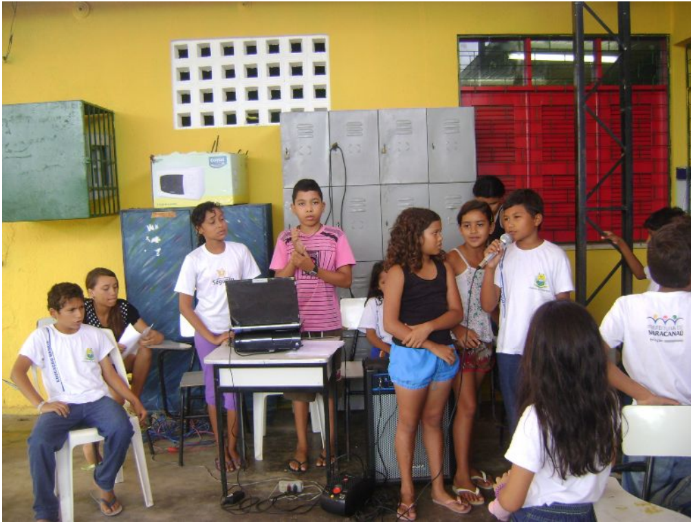
Oficina de Rádio Escola – Programa Mais Educação – Escola Maria de Lourdes Silva

e) Fanfarras: atividade geralmente desenvolvida na sala de aula, sem os instrumentos musicais, utilizando apenas quadro branco e pincel. As aulas são quase sempre expositivas. Poderia ser a oficina mais interessante, contudo, parece ser a mais rejeitada, pois o monitor não tem condições de utilizar os recursos que possui, devido a falta de espaço que não cause transtornos às demais atividades que ocorrem na escola. Algumas vezes propõe atividade fora da escola, evitando assim, maiores constrangimentos aos demais colegas de trabalho e alunos.