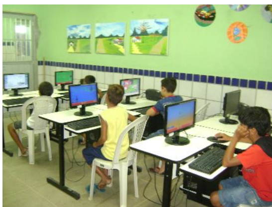
Laboratório de Informática