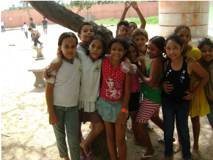
Atividade do Programa Segundo Tempo – Escola Maria de Lourdes Silva

O educador físico, coordenador do Programa Segundo Tempo, tenta dar conta dos alunos jogando, dos que haviam saído para resgatar a bola na rua, dos que integram o time reserva e ainda dos que se dispersam pela escola.