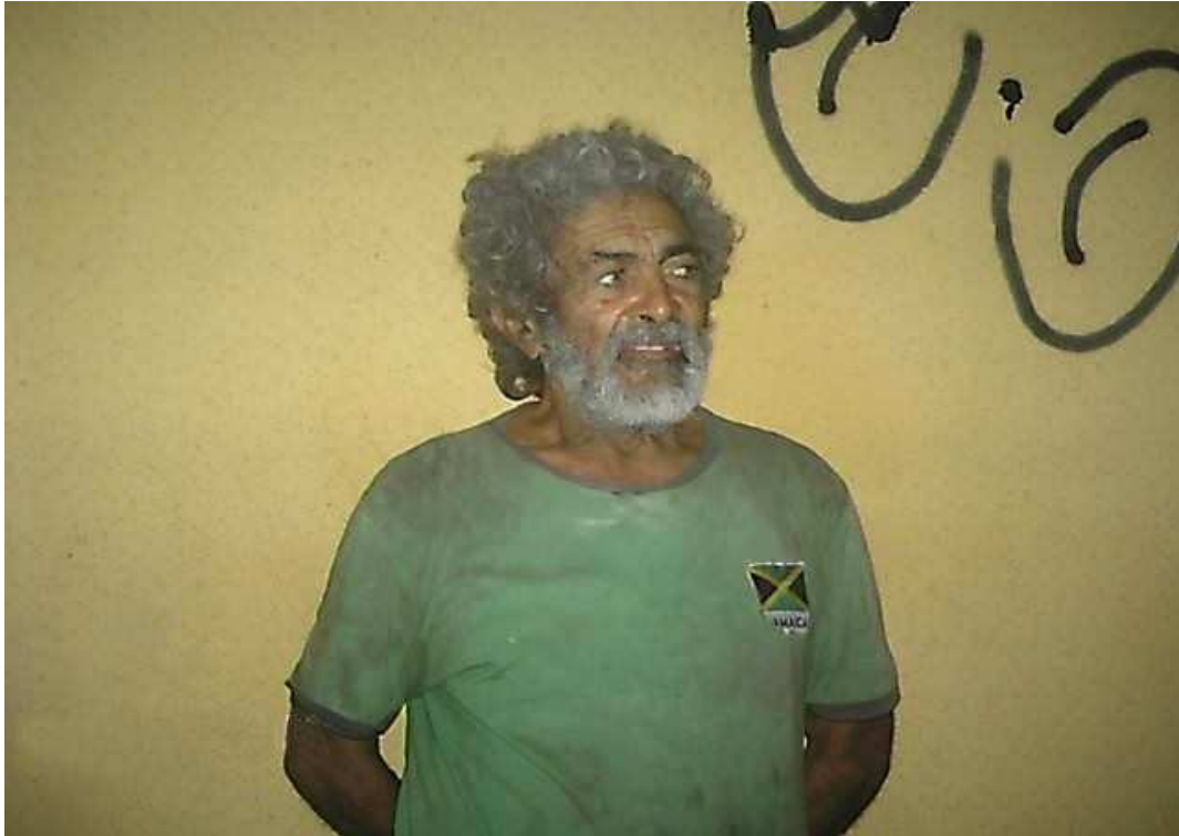
Foto V – Morador de rua que dormia próximo ao Hospital Geral de Fortaleza, que abordamos por ocasião da Checagem do Mapeamento. Fez questão de pousar para foto.