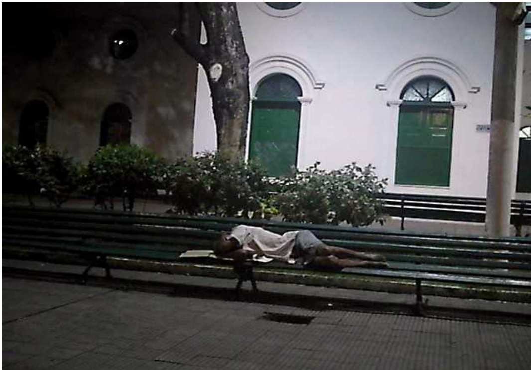
Foto VI – Morador de rua dormindo na Praça do Carmo (Checagem do Mapeamento)