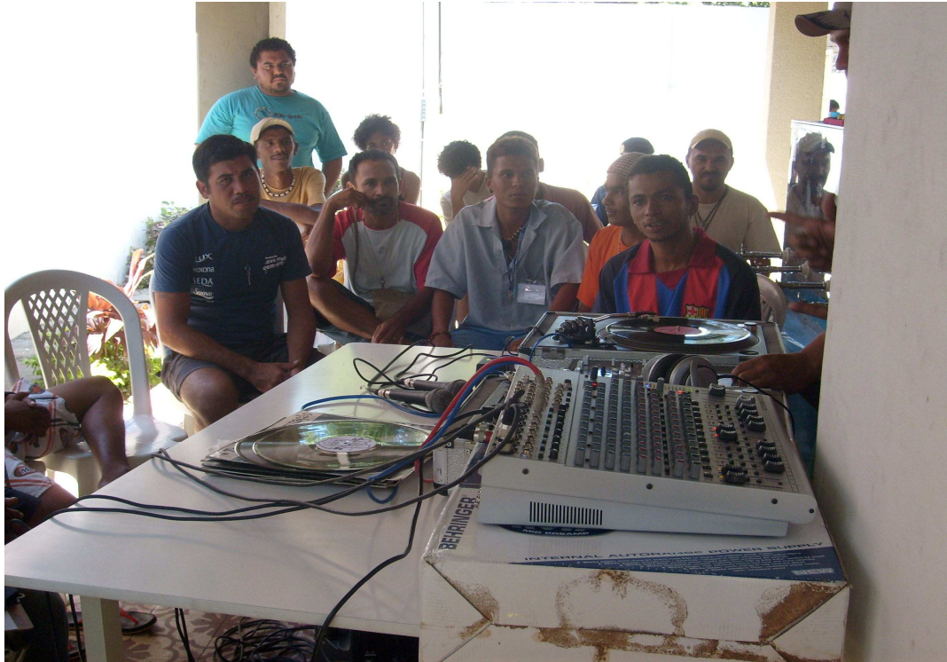
Foto VII – Oficina de Hip-Hop para os moradores de rua que freqüentam o CAPR